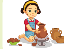
Chằm men gốm