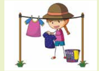
Làm công việc nhà